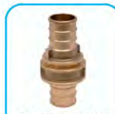
Raccordo UNI 804