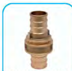
Raccordo UNI 804